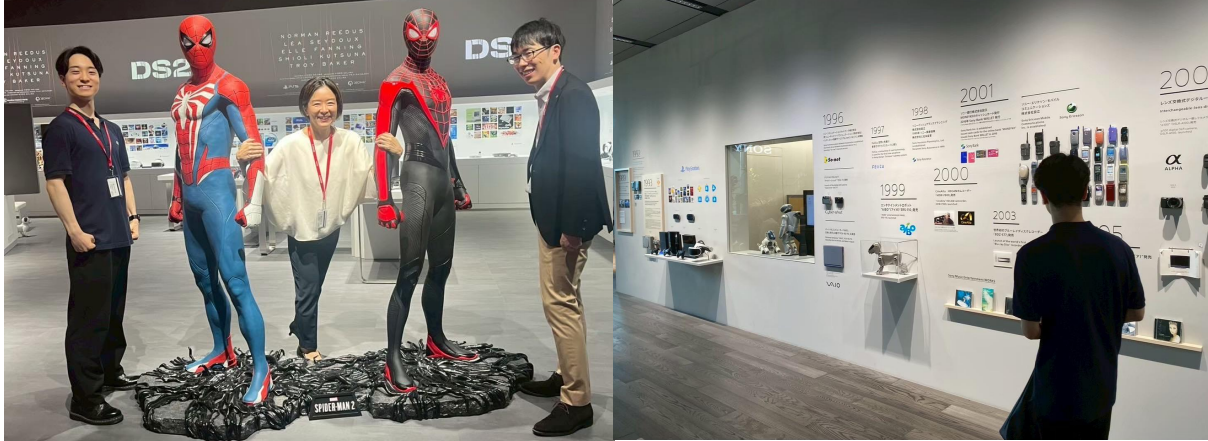
企業訪問（ソニースクエア）